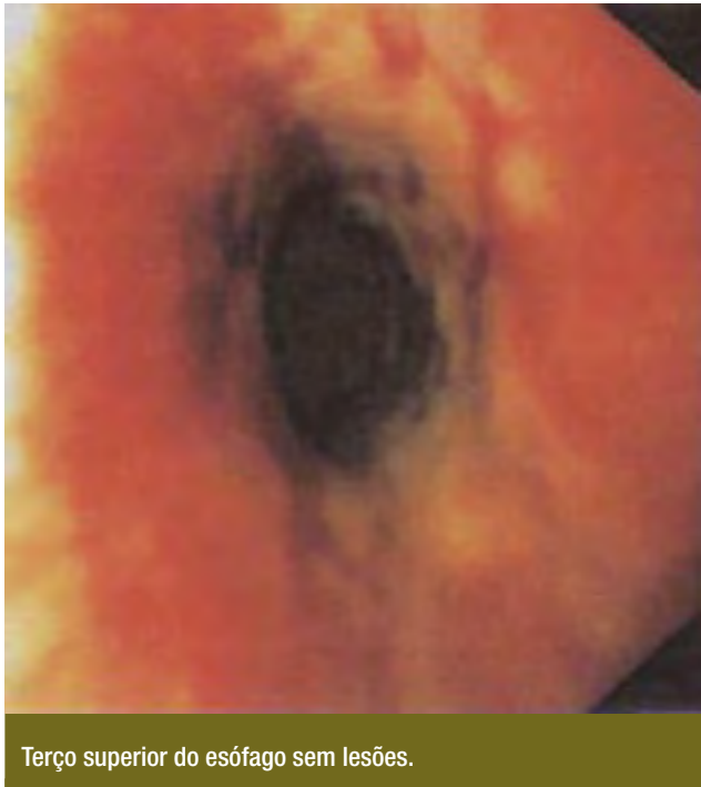
Terço superior do esófago sem lesões.