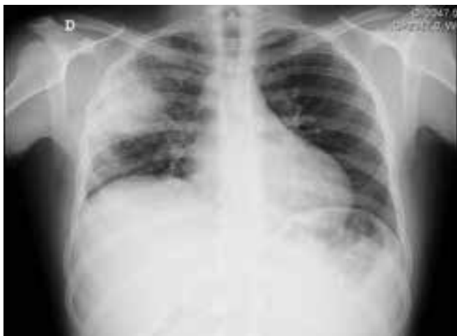
Figura 1: Telerradiografia do tórax com opacificação no lobo superior direito

cos da hepatite B e C e do vírus da imunodeficiência humana foram negativos. As serologias para o Aspergillus , Legionella pneumophila , Leptospira , Salmonella , Brucela , Toxoplasma , Hidatidose , Citomegalovírus , Mycoplasma pneumoniae , Listeria monocytogenes , Rickettsia conorii e sífilis foram negativas para infecção aguda. O complemento, as imunoglobulinas G, A, M e a enzima conversora da angiotensina (ECA) estavam dentro dos valores de referência. A pesquisa de auto-anticorpos anti-nucleares (ANA) e anti-citoplasma dos neutrófilos (ANCA) foi negativa. A imunofenotipagem do sangue periférico foi negativa.